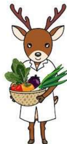
（公社）奈良県栄養士会 新マスコット 鹿 奈 栄 ちゃん